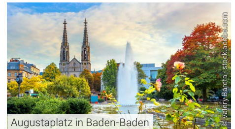
Augustaplatz in Baden-Baden

Bitte beachten Sie unsere gesonderten Stornobedingungen lt. unseren AGBs.