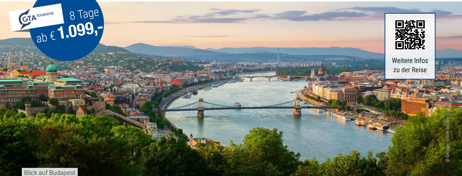
Blick auf Budapest